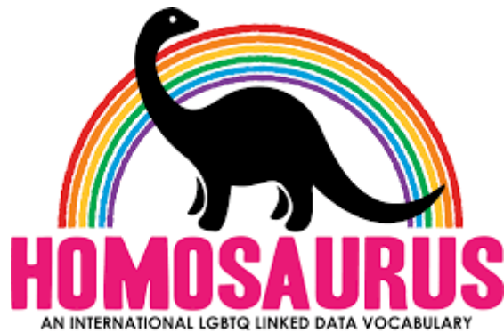
Fig. 1: Ejemplo de herramienta actual de indización en acceso gratuito a la temática

LGBT Thought and Culture [En línea]. Alexandria, VA: Alexander Street Press. http://alexanderstreet.com/products/lgbt-thought-and-culture [Consulta: mayo 2021].