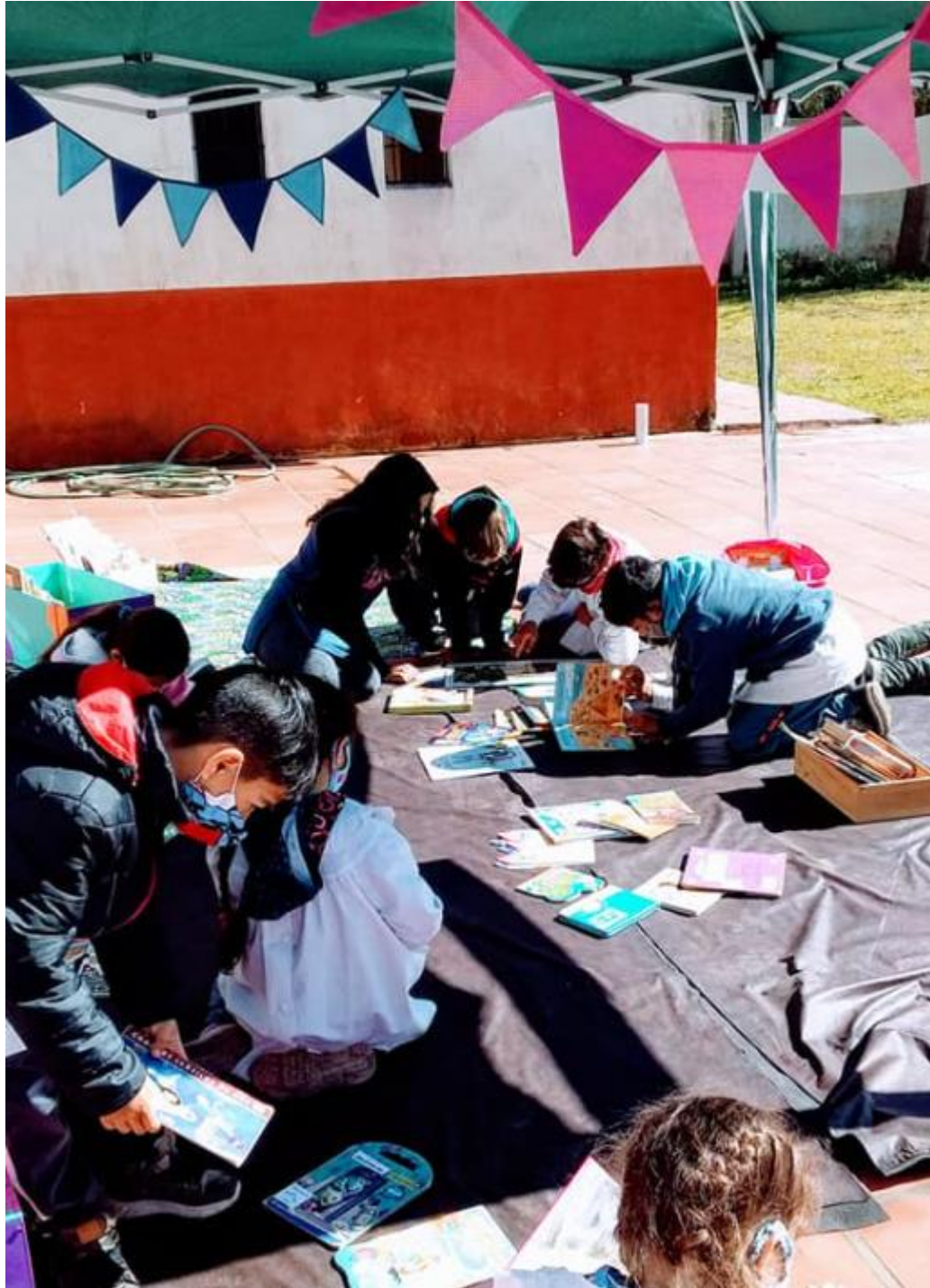
Lectores de escuelas rurales disfrutando del material bibliográfico que ofrece Ábrete Libro