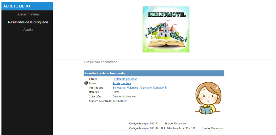
Imágenes del OPAC de “Ábrete Libro”