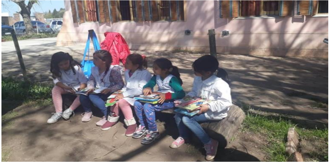
Alumnas de la EP N° 14 (sector rural) en una visita de Ábrete Libro , año 2019.