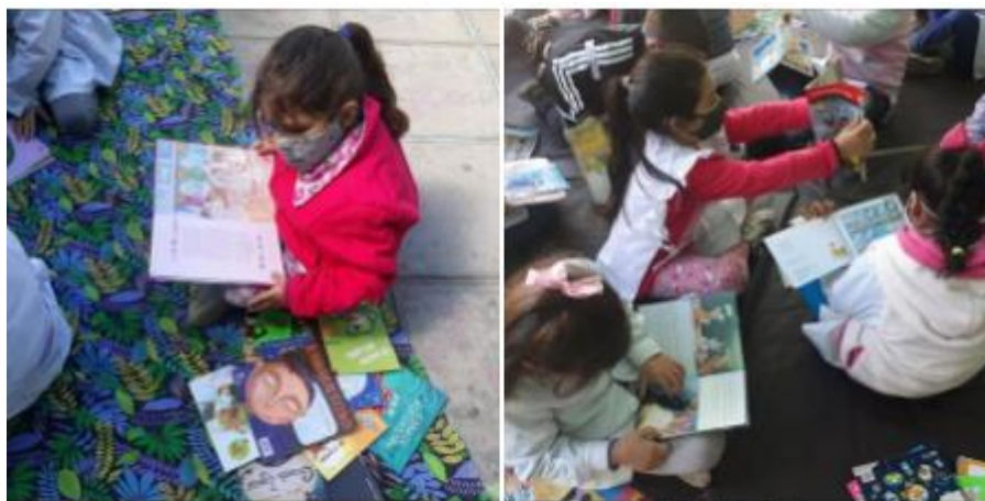
Niños y niñas de la EP N° 30 de Dolores, año 2021.

usuarias. Ante la puesta en marcha del OPAC se sumaron dos bibliotecarias escolares, quienes tienen acceso al sistema por medio de una clave suministrada y pueden realizar las mismas tareas que las bibliotecarias de Ábrete Libro. El OPAC es el primer catálogo en línea que se originó en la ciudad de Dolores y puede ser una oportunidad para que se sumen otras unidades de información de la localidad, para mejorar la cooperación bibliotecaria persiguiendo siempre objetivos comunes y poniendo al servicio, el personal y los medios necesarios para garantizar el acceso democrático a la información.