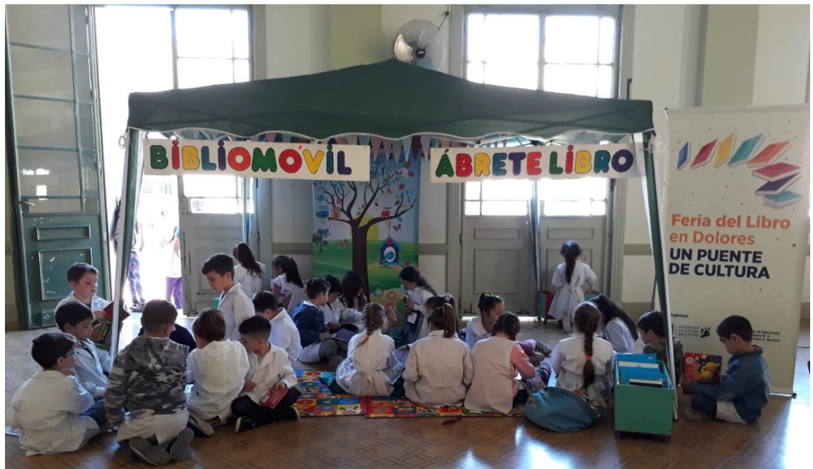
La Bibliomóvil en la EP N° 4 de Dolores, en el marco de la Feria del Libro, año 2019

Ábrete Libro acerca la literatura infantil a lugares en los que no se accede a bibliotecas por cuestiones de tipo social, económico o geográfico. Para esto se utiliza un gazebo, lonetas, almohadones, colchonetas y todo tipo de material para garantizar comodidades a los usuarios y las usuarias. Su colección fue creciendo gracias a donaciones provenientes desde muchos puntos del país, la biblioteca es itinerante y a su vez es un centro cultural ambulante que cuenta con material bibliográfico para las infancias. En las diferentes localidades y espacios que visitan realizan diversas actividades destinadas a niños y niñas entre las que se destacan lecturas, cuentacuentos, talleres de poesía e historietas, visitas de escritores y escritoras, narraciones dramatizadas, títeres, música, charlas sobre medioambiente, talleres de ESI, participación en Ferias del Libro y más. Todas las actividades se desarrollan por lo general al aire libre y siempre respetando los protocolos correspondientes para asegurar el cuidado necesario en el marco de la pandemia originada por el COVID 19.